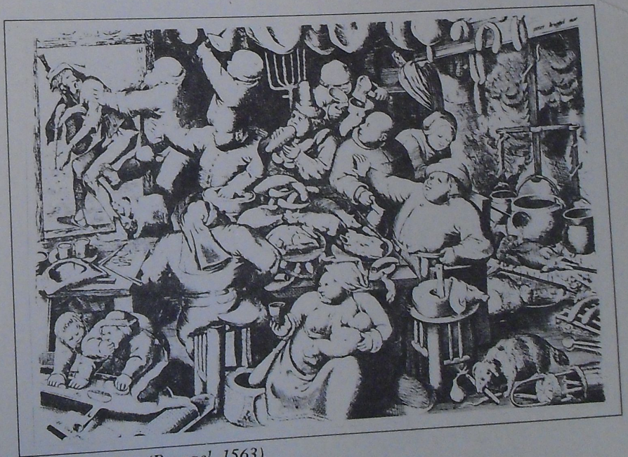
De rijke keuken (Bruegel, 1563).

Ik voeg er van mijn kant aan toe: zo'n aanzienlijke vertraging van het tempo waarmee we oudere dingen vervangen zal ook op het vlak van de verbruiksgoederen het enige middel zijn om grondstoffenverbruik (energie-verbruik inclusief) en vervuiling kunnen verminderen. Wat we nodig hebben, is dus geen 'duurzame economische ontwikkeling', zoals de nieuwe slogan van de EG-bureaucratie luidt, maar gewoon: meer duurzame produktiemiddelen en gebruiksgoederen. Dat moet evenwel niet tot verarming of 'versobering' leiden, maar zal in feite een verrijking betekenen: is niet 'rijk' wie voldoende en voor goed van alles voorzien is van wat hij, zelfs voor de rest van zijn leven, nodig heeft? We moeten ons niet inspannen om één of andere doelloze 'ontwikkeling' in gang te houden, maar om de behoeften van de mensen 'voor goed' te bevredi-