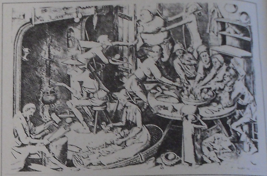
De arme keuken (Bruegel, 1563).

Op 11 en 12 maart (telkens vanaf 14 en 20 u.) richt Elcker-ik Antwerpen vier seminaries in om de stellingen te bespreken over 'armoede of soberheid', verdedigd in een recente Leidse doctoraatsverhandeling door Raf Janssen (1990).